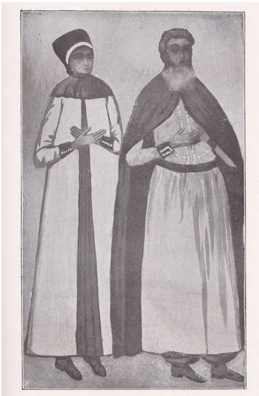
Stoichi Ro ianu i Dochia, so ia sa (dup Gorjul istoric i pitoresc , Tg. Jiu, 1904, p. 219)